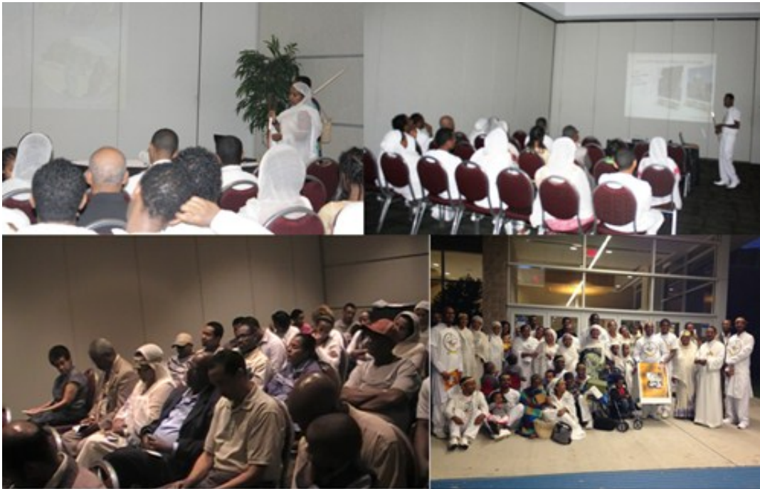
“በእንተ ስማ ለማርያም...” ዓውደ ርዕይ በዳላስ ከተማ

ዓውደ ርዕዩን በዳላስና አካባቢው የሚገኙ ቁጥራቸው ፫፻ የሚደርስ ምዕመናን ጎብኝተውታል።